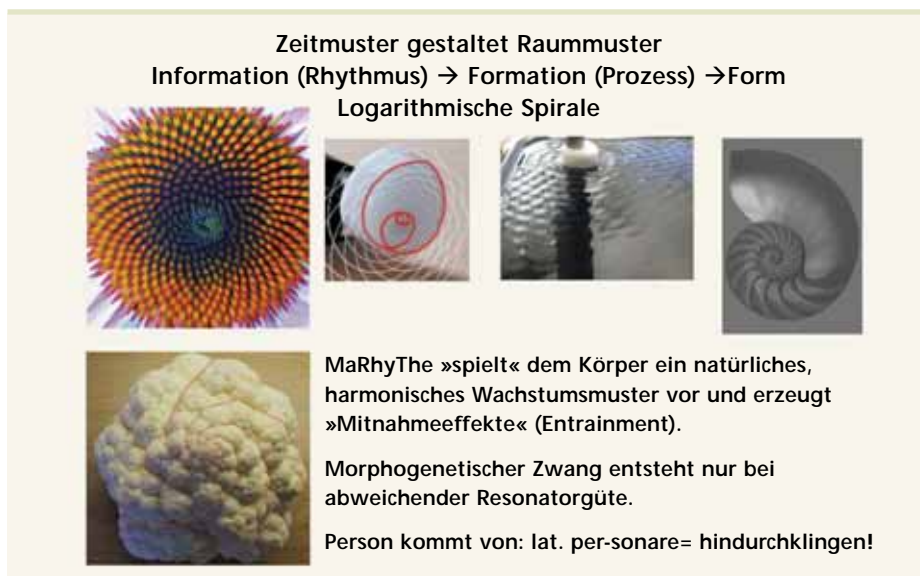
Abb. 1_Der patentierte Schwingungsgeber (logarithmische Spirale) koppelt sich stressfrei (sympatholytisch-vagoton) in physiologische Prozesse ein und erfüllt dabei sowohl die geometrisch-fraktalen Anforderungen zur Rekonstruktion verlorener biologischer Zeitmuster (Rhythmen) als auch biologischer Raummuster (Strukturen)

Die Ideen der Kybernetik, der Chaostheorie und der nicht-linearen Thermodynamik irreversibler Systeme beflügelten unsere damaligen Experimente mit dem Videomikroskop im Rahmen unserer Forschungsarbeiten. Zum ersten Mal konnten wir Zellprozesse an frischen, menschlichen Zellbiopsien dar- >>>