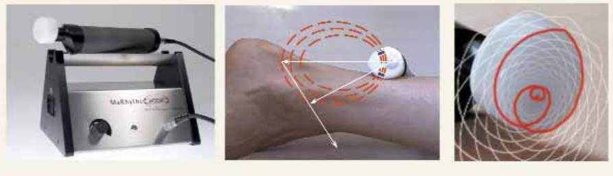
Abb. 3_Links: MaRhyThe-Gerät; Mitte: magnetisches Feld; rechts: spezifische harmonische Wellenform des Resonators, die mechanisch in das Gewebe eingebracht wird und sich dort als rhythmisches, logarithmisches Zeitmuster modulierend aufbaut

(»synchrone Kooperation« und »Koppelung der Oszillatoren«)