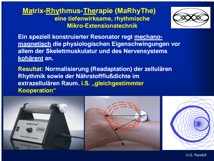
Abb.1: Links: Matrixmobil®; Mitte: Magnetisches Feld; Rechts: Spezifische harmonische Wellenform des Resonators die mechanisch in das Gewebe eingebracht wird und sich dort aufbaut.

Für die Mikrozirkulation, egal in welchem Organ im Körper, ist eine intakte, charakteristische Resonatorgüte der Skelettmuskulatur hauptverantwortlich.