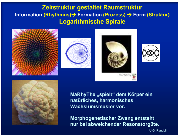
Abb.2: Die Therapie ist dann beendet, wenn kein „morphogentischer Zwang“ mehr besteht, d.h. die ursprüngliche Resonatorgüte der Gewebe wieder hergestellt ist.

Eine sanfte, harmonische Adaptation der Schwingungen an das Gewebe garantiert der patentierte Schwingkopf, sodaß die Gefahr von Bänderüberdehnungen bzw. der Resonanzkatastrophe bei inneren Organen grundsätzlich ausgeschlossen werden.