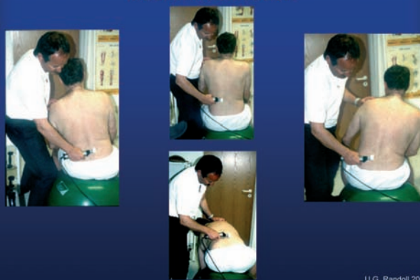
Abb. 3 / 4: Unter Ausnutzung verschiedenster Lagerungshilfsmittel (z. B. Lojer-Spezialliege, Pezziball) werden systematisch kontrakte Muskel- und Sehnenfaszien sowie Tender- und Triggerpoints aufgespürt (diagnostiziert) und zeitgleich sanft eliminiert (therapiert).

ge der chronisch kontrakten (verkürzten) Muskelanteile die „Tenderpoints“. Es sind ebenfalls resultierende azidotische Areale an den Sehnen, die auf